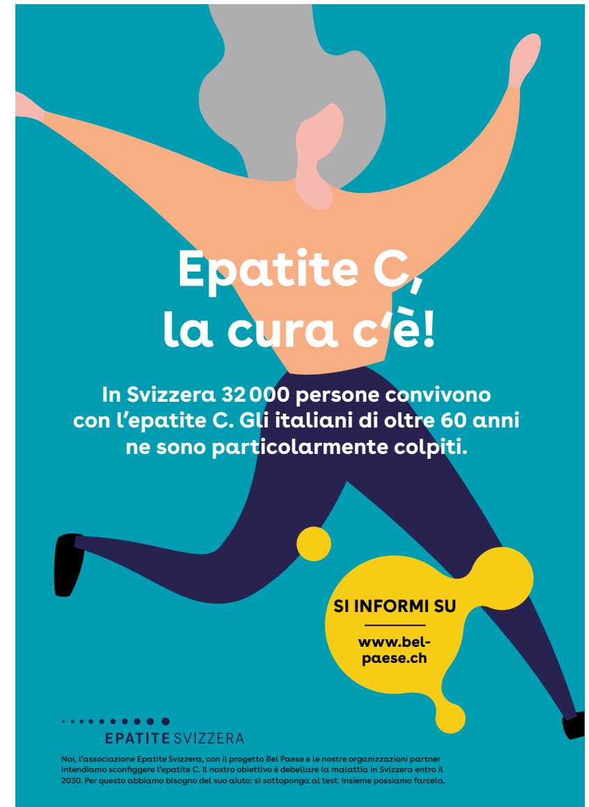
Abb.: Merkblatt Hepatitis C auf Italienisch

Die, im Rahmen der Projektevaluation im September durchgeführte Befragung einer Fokusgruppe von Teilnehmer:innen einer BelPaese-Veranstaltung, war sehr aufschlussreich. So war die grosse Akzeptanz für das Thema augenscheinlich, aber auch die noch herrschende Unklarheit über die verschiedenen Hepatitiden. Deshalb werden in Zukunft an den Veranstaltungen neben Hepatitis C auch Hepatitis B und A eingehender behandelt. Zudem hat sich gezeigt, dass einige Teilnehmer:innen in der Vergangenheit aufgrund einer Infektion mit Hepatitis Diskriminierungserfahrungen