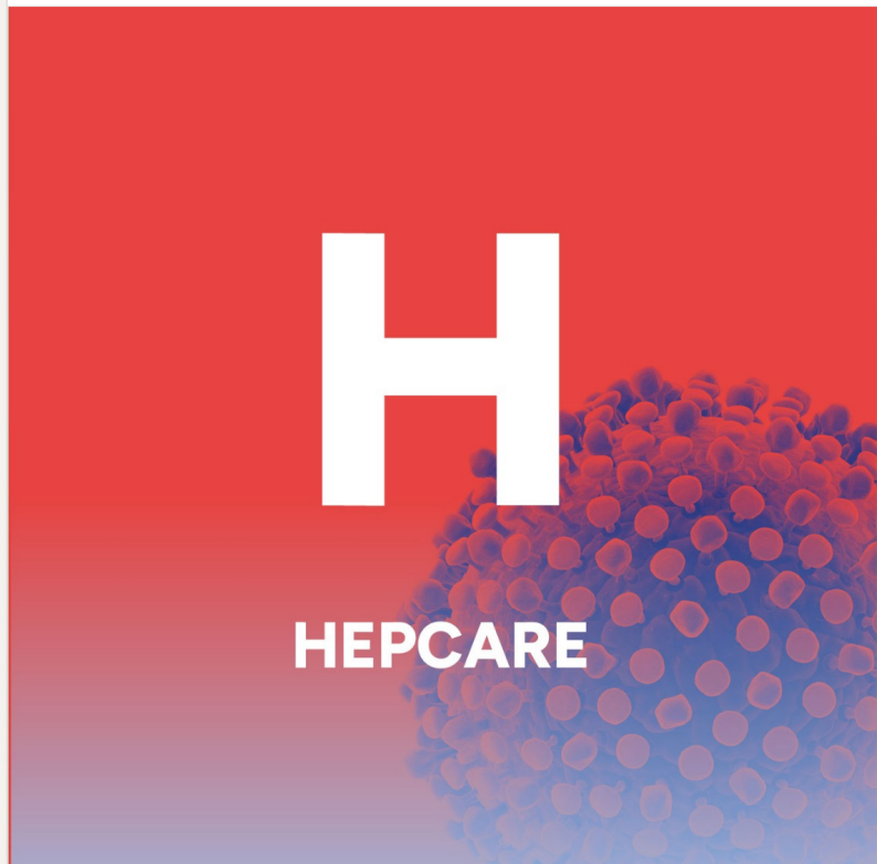
Abb.: HepCare in der LinkedIn-ABC-Kampagne

Eine #Hepatitis-C -Therapie kann heute auch in der #Hausarztpraxis durchgeführt werden. HepCare , ein Projekt von Hepatitis Schweiz, unterstützt dabei. ... mehr