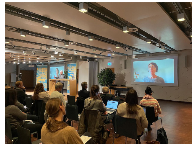
Abb.: Swiss Hepatitis Symposium 2024