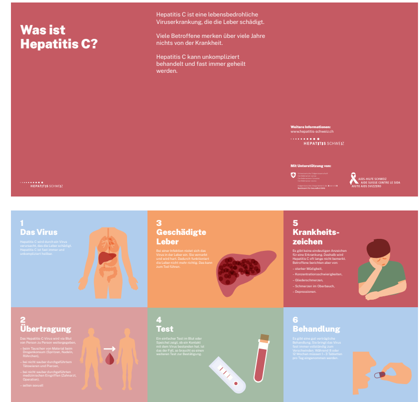
Abb.: SHiPP-Faltblatt «Was ist Hepatitis C?»

Mit dem Bericht der Schlussevaluation des Programms und der Projekte, den «Schlussfolgerungen SHiPP –Swiss HepFree in Prisons Programme: Gute Praxis entlang des Behandlungspfades», sowie dem Abschlussbericht zuhanden des Bundesamtes für Gesundheit BAG, wurden Ende Jahr mehrere Meilensteine des Programms erreicht. All diese Dokumente nehmen auf die ersten zehn SHiPP-Projekte Bezug und werden um die Erkenntnisse der zusätzlichen Projekte im Jahr 2025 erweitert werden.