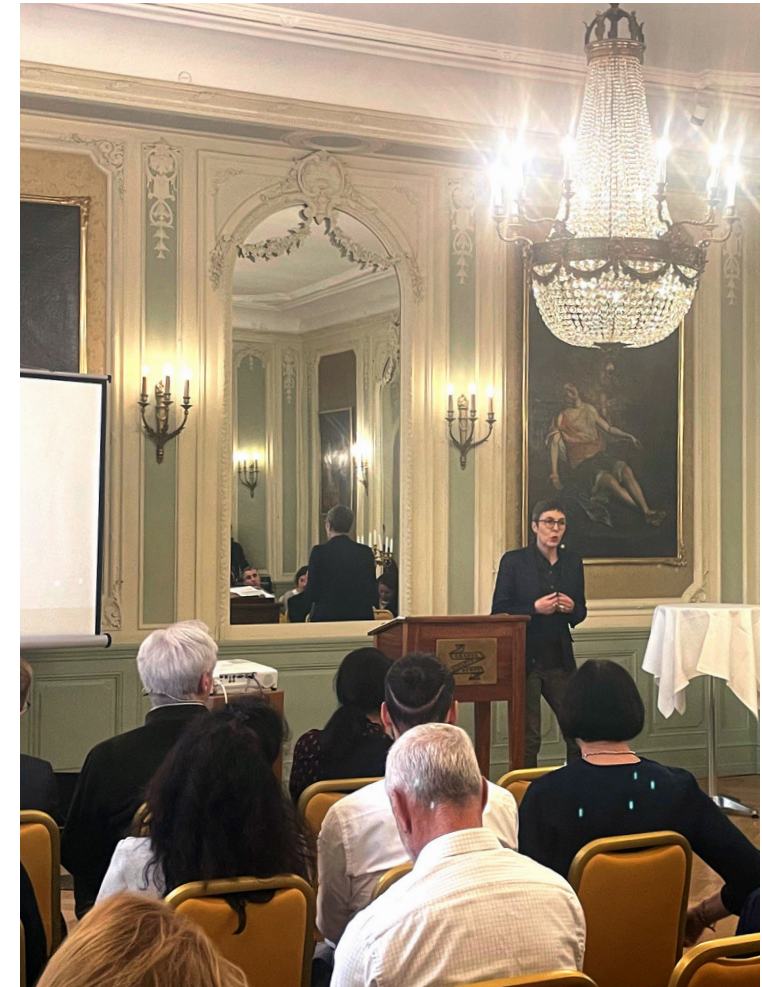
Abb.: 10 Jahre Schweizer Hepatitis-Strategie

Die ehemalige Bundesrätin Ruth Dreifuss ist Mitinitiantin des Netzwerks und war ebenfalls beim Kick-off-Meeting vor zehn Jahren dabei. Damals hatte die ehemalige Gesundheitsministerin angeregt, dass Synergien mit Infektionskrankheiten wie HIV genutzt werden sollten, um ein solches Programm ressourcenschonend und effizient umzusetzen. Ruth Dreifuss konnte bei diesem Treffen nicht dabei sein; sie schickte aber eine